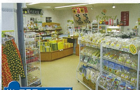
サンフラワーショップ

北竜町特産品の黒千石大豆を用いたお菓子やひまわりのグッツなど豊富に取り揃えています。